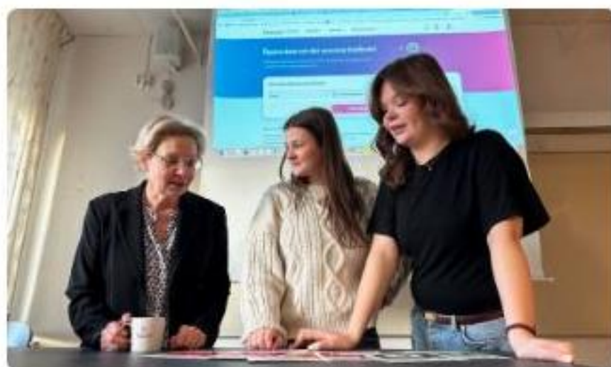
Openaid i klassrummet

Här har du som lärare och utbildare tillgång till pedagogiskt material att använda i undervisningen och andra lärmiljöer. Det är material för kompetensutveckling i lärande för hållbar utveckling och globala utvecklingsfrågor för pedagoger, rektorer och ledare inom grundskola, gymnasium och vuxenutbildning. Många av övningarna går bra att använda i andra sammanhang som till exempel studiecirklar, föreläsningar och andra forum.