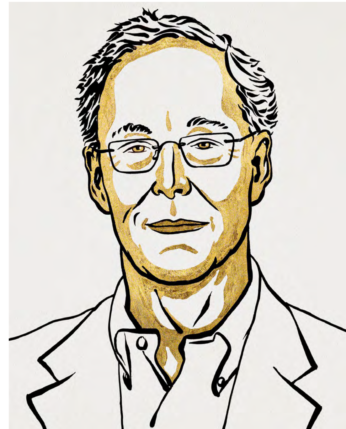
Douglas W. Diamond Född: 1953