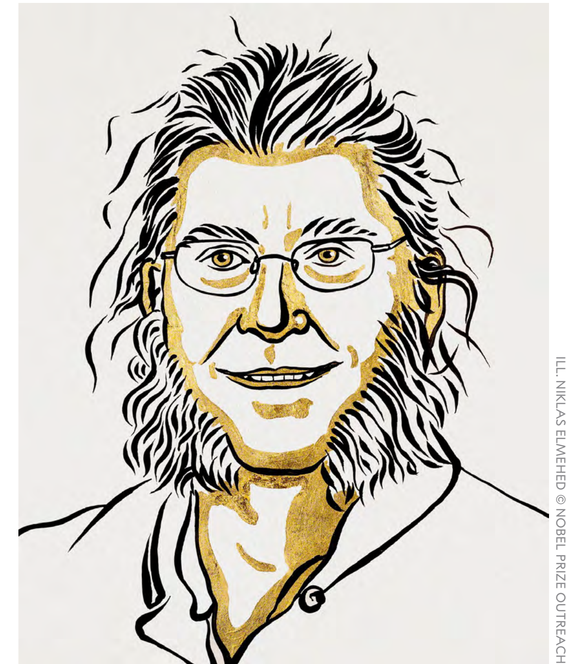
Philip H. Dybvig Född: 1955