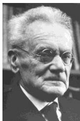
Karl von Frisch

Nobelpriset i Fysiologi eller medicin 1973