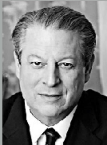
Intergovernmental Panel on Climate Change (1988)