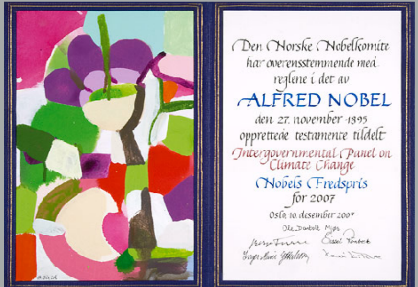
Artist: Britt Juul. Calligrapher: Inger Magnus.