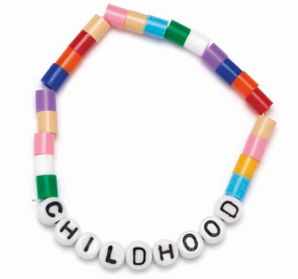
De olika färgerna på armbandet står för barns olika rättigheter.

Gör gärna ett eget armband och ge bort det till någon du tycker förtjänar det.